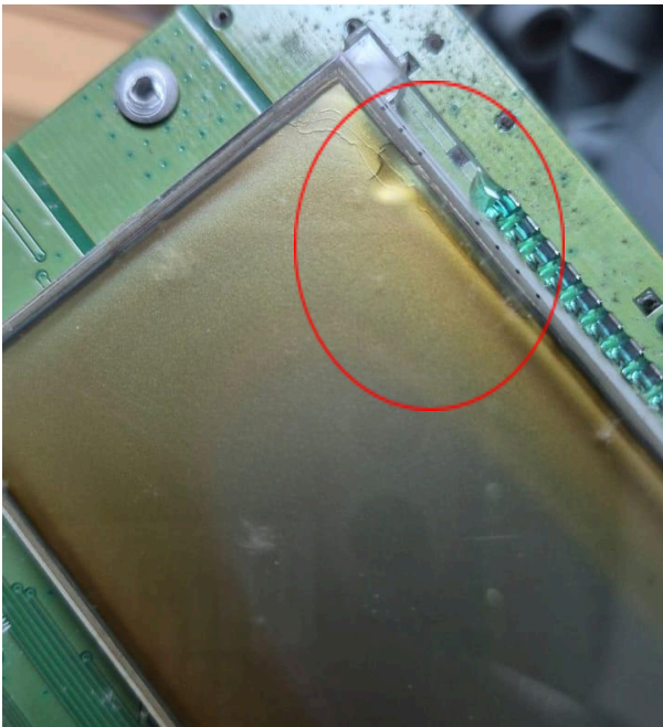
Figura 1: Fisura que presenta la pantalla del display.