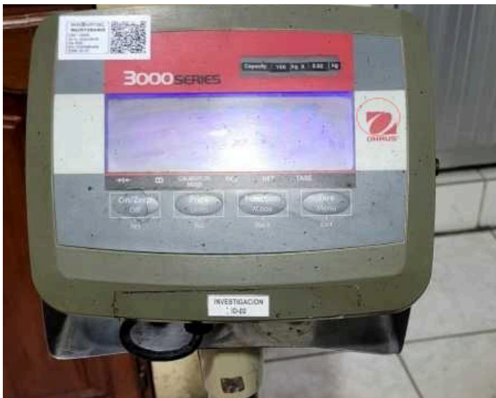
Figura 3: Encendido del equipo.