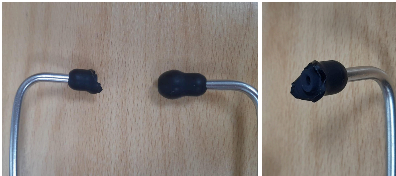
Figura 3. Auricular con pieza plástica protectora rota