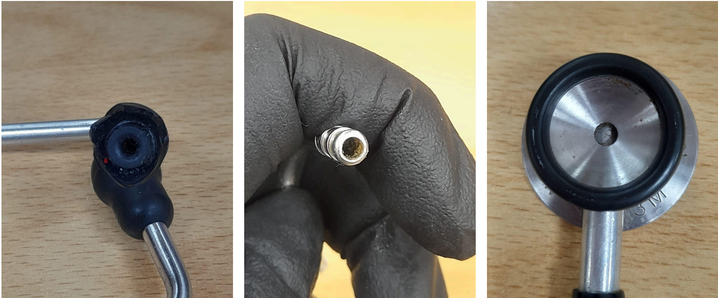
Figura 2. Residuos biológicos antes de mantenimiento