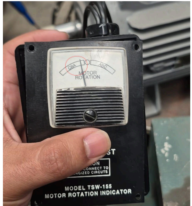
Figura 2: Giro sentido antihorario.