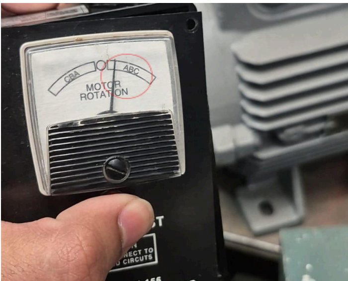
Figura 3: Giro sentido horario.