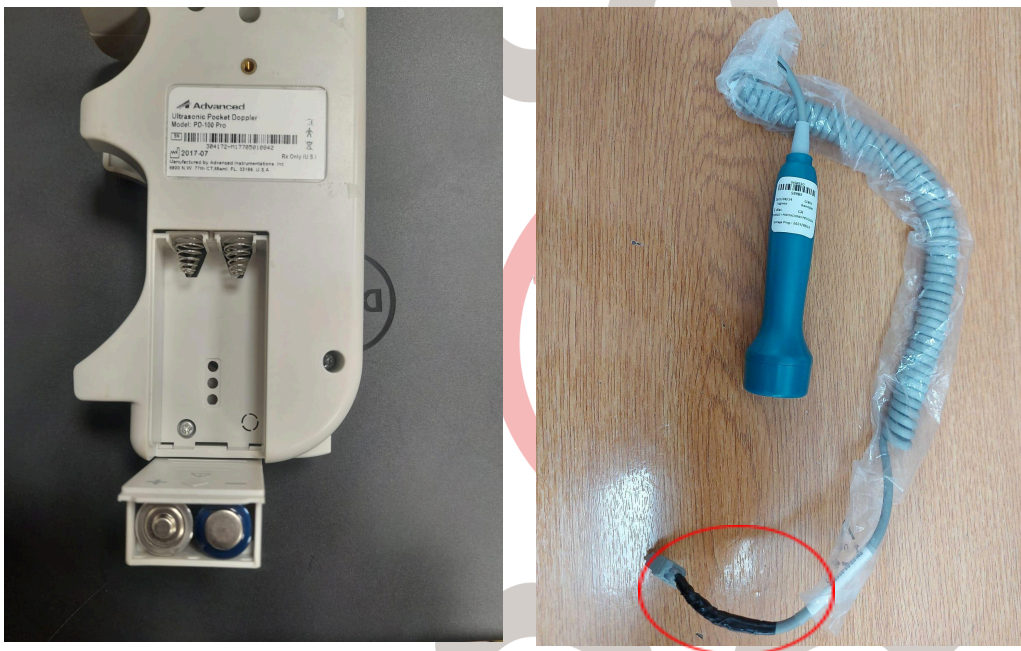
Figura 2. Parte eléctrica y daño en recubrimiento del sensor.