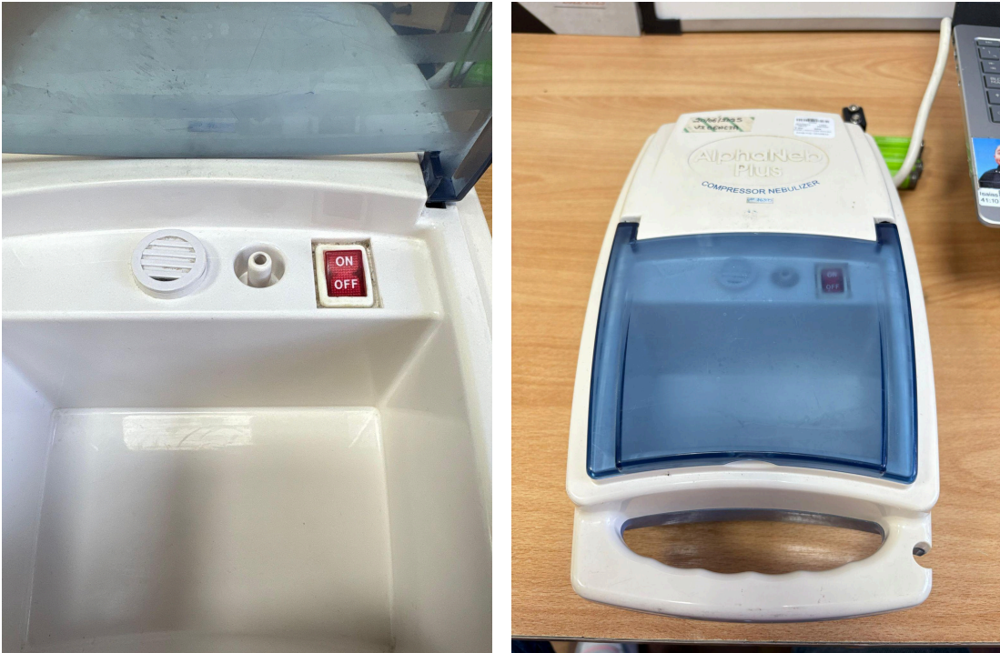
Figura 1. Vista General del Equipo.