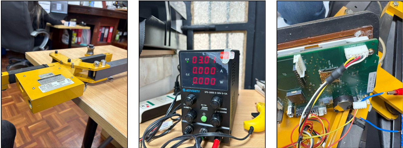
Fig. 1 Revisión técnica