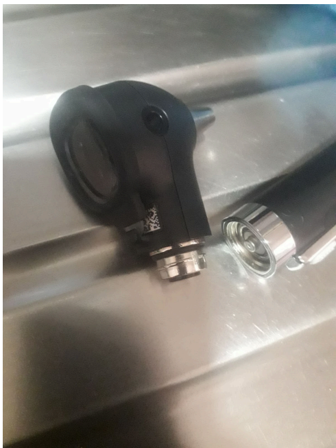
Figura 4. Compartimento de Baterías en buen estado