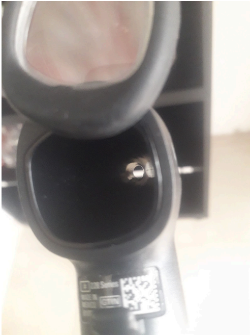
Figura 1. Presencia de residuos orgánicos