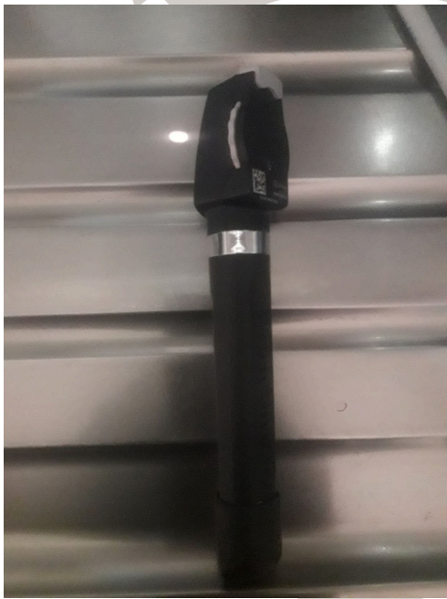
Figura 3. Oftalmoscopio funcionando correctamente