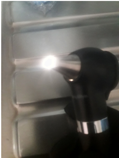
Figura 2. Otoscopio funcionando correctamente