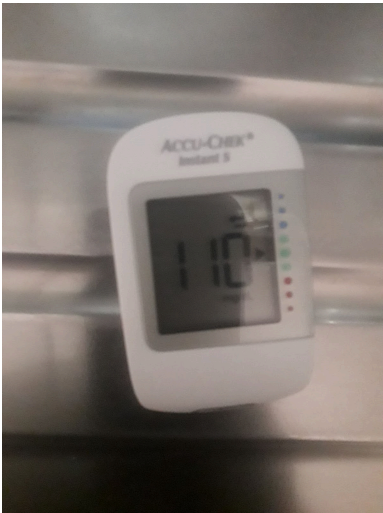
Figura 1. Lector funcionando correctamente