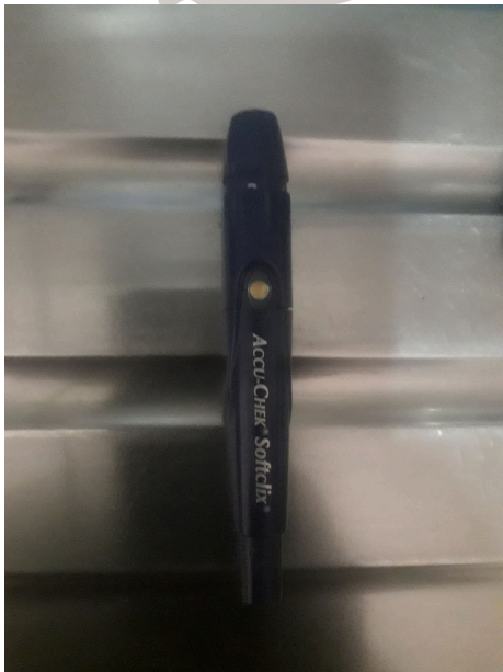
Figura 2. Lancero en buen estado y funcionando