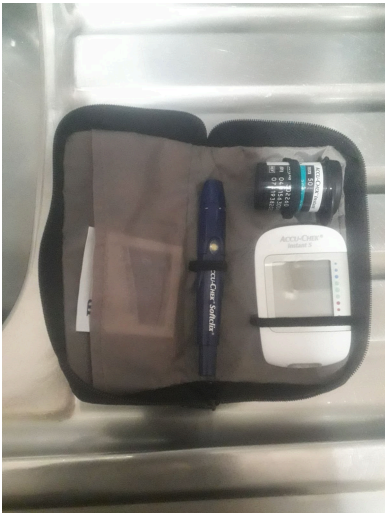
Figura 2. Vista general del equipo