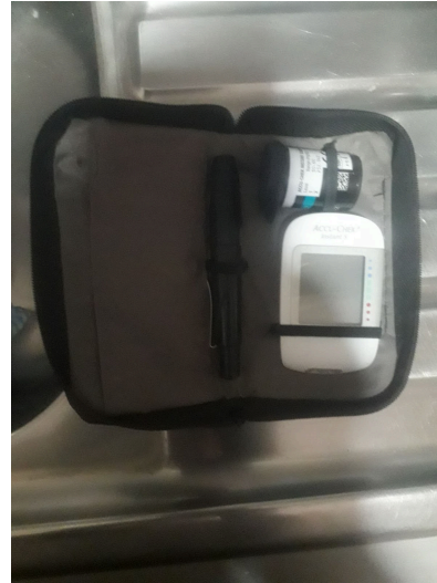
Figura 2. Vista general del equipo