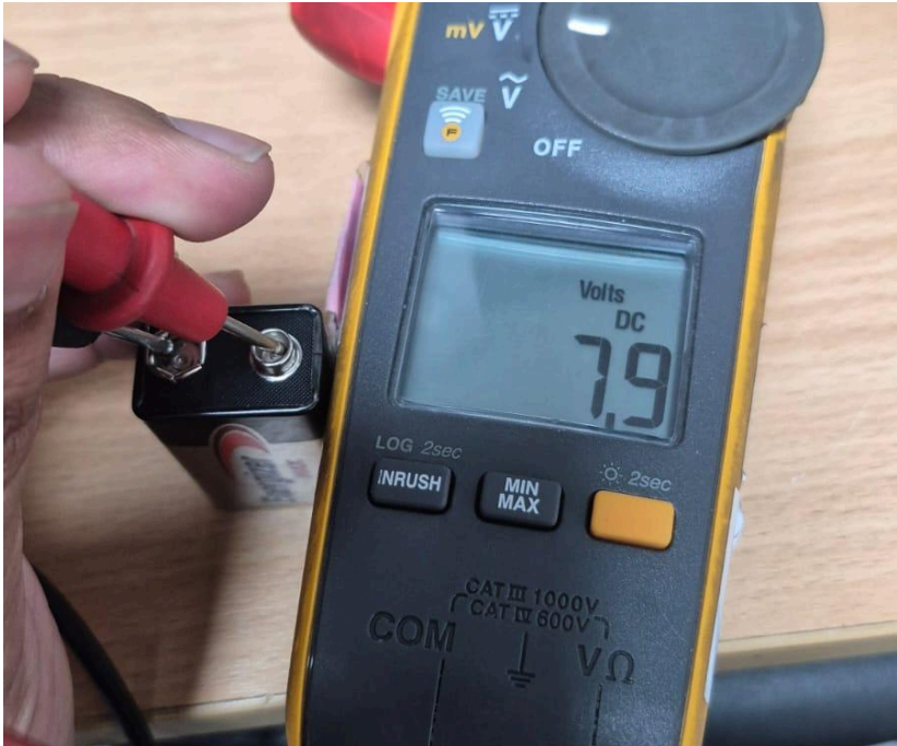
Figura 1. Estado de la batería.