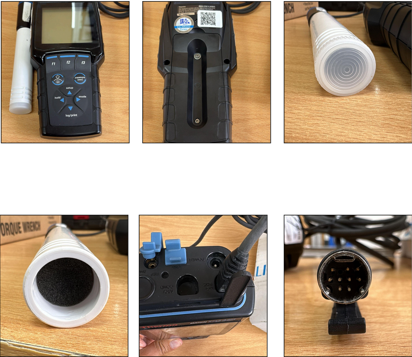
Fig. 1 Mantenimiento preventivo básico