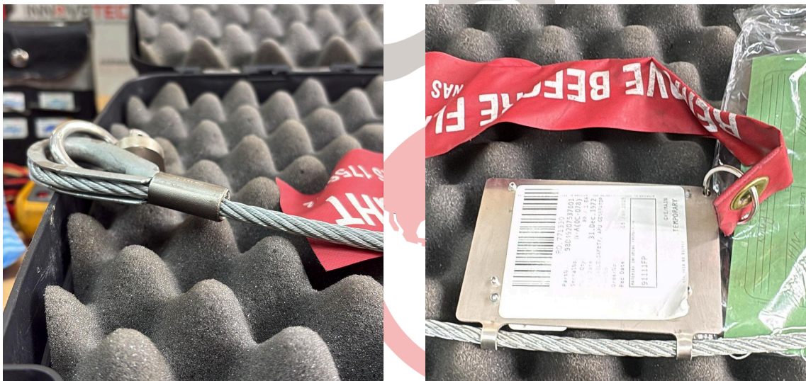
Fig. 2 Mantenimiento