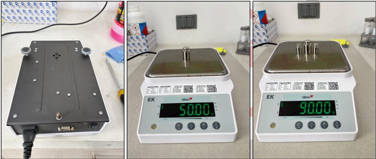
Fig 3. Parte externa