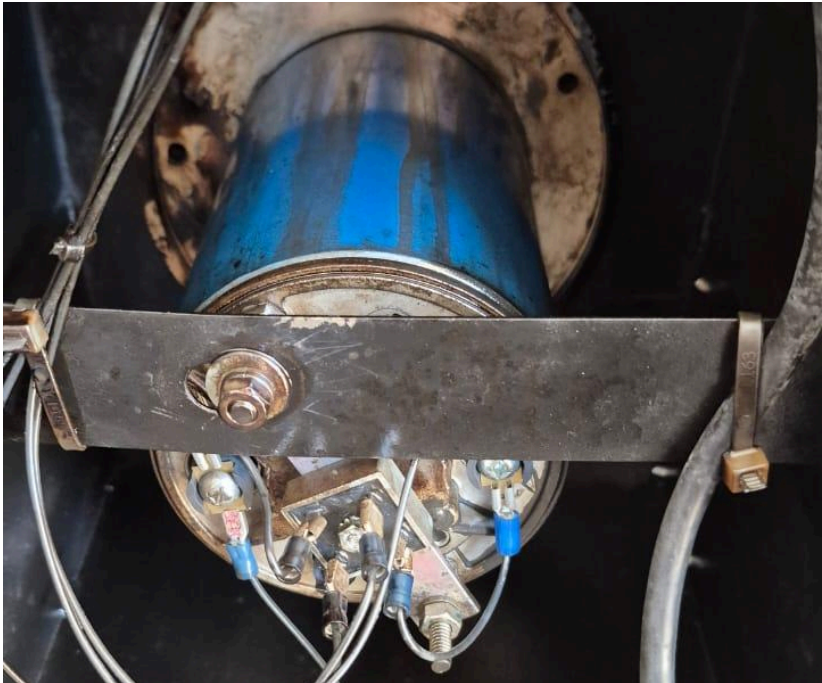
Figura 1. Estado del motor.