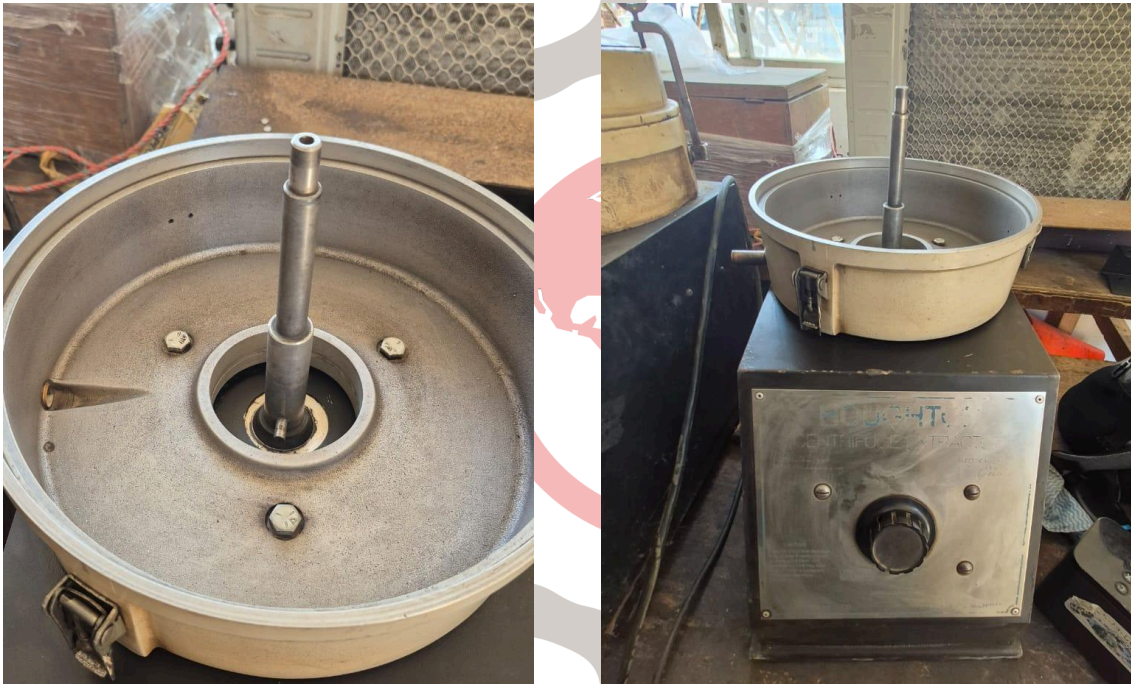
Figura 2. Vista frontal y del plato del equipo.