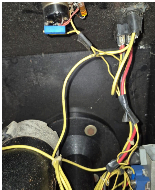
Figura 4. Cableado interno.