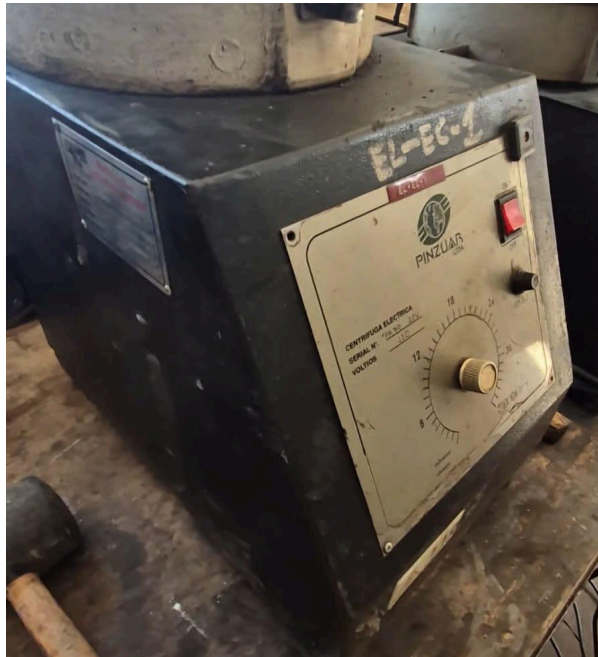
Figura 1. Vista del equipo.