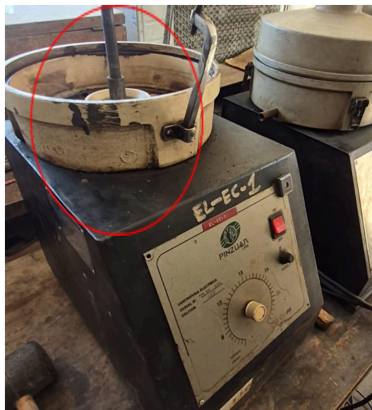
Figura 2. Eje del equipo.