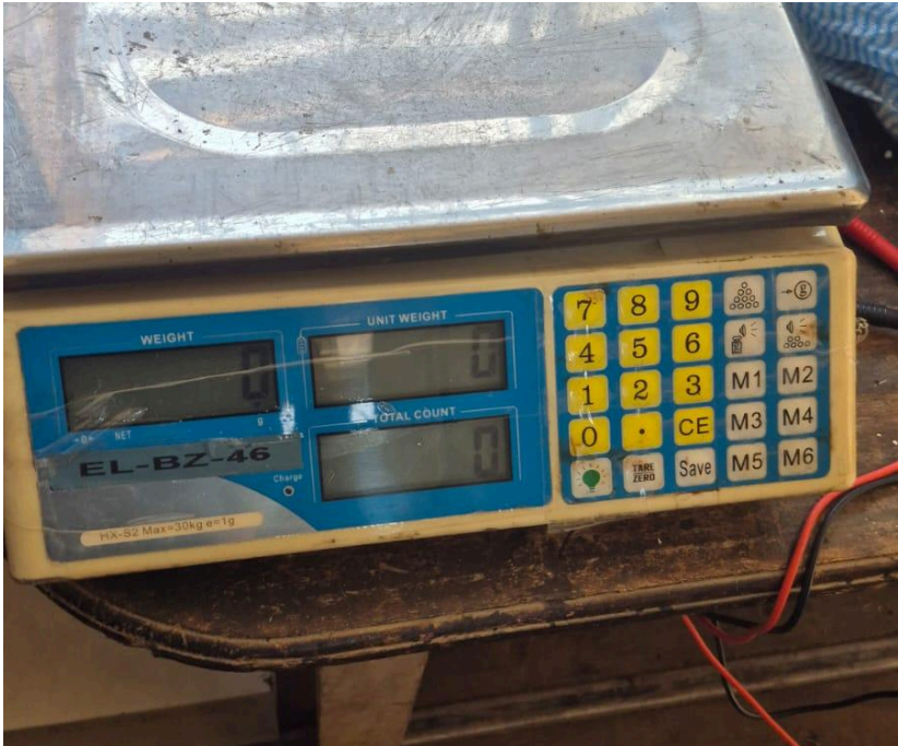
Figura 1. Equipo encendido.