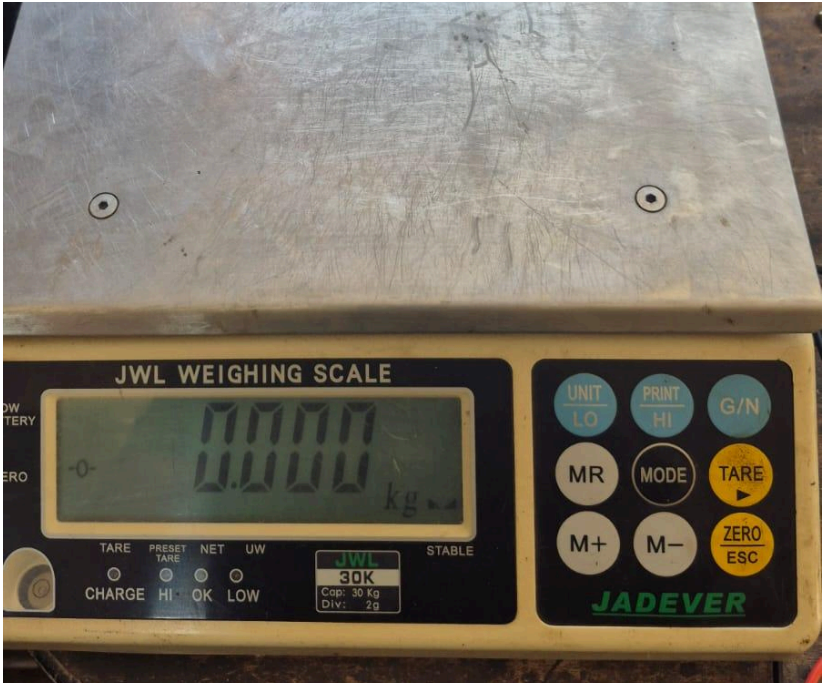
Figura 1. Equipo encendido.