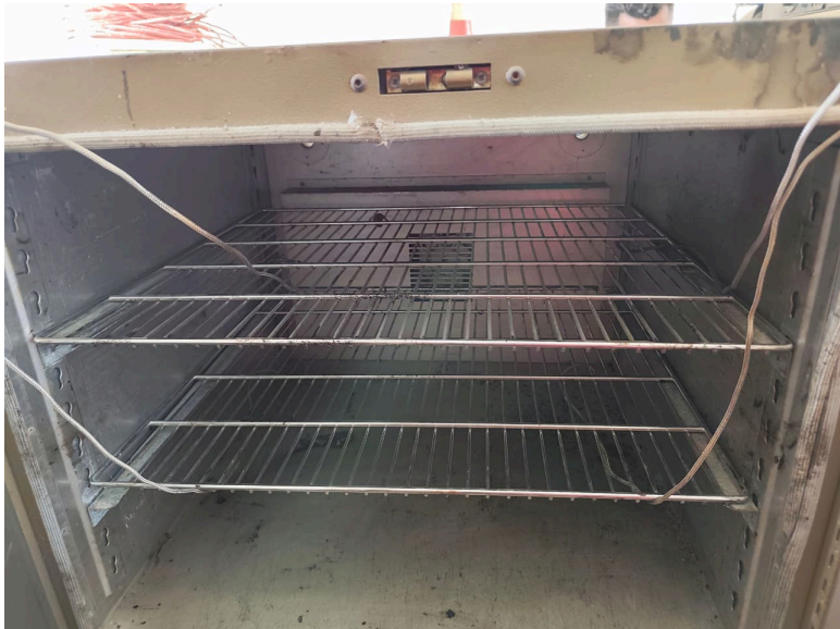
Figura 2. Ubicación de Termocuplas