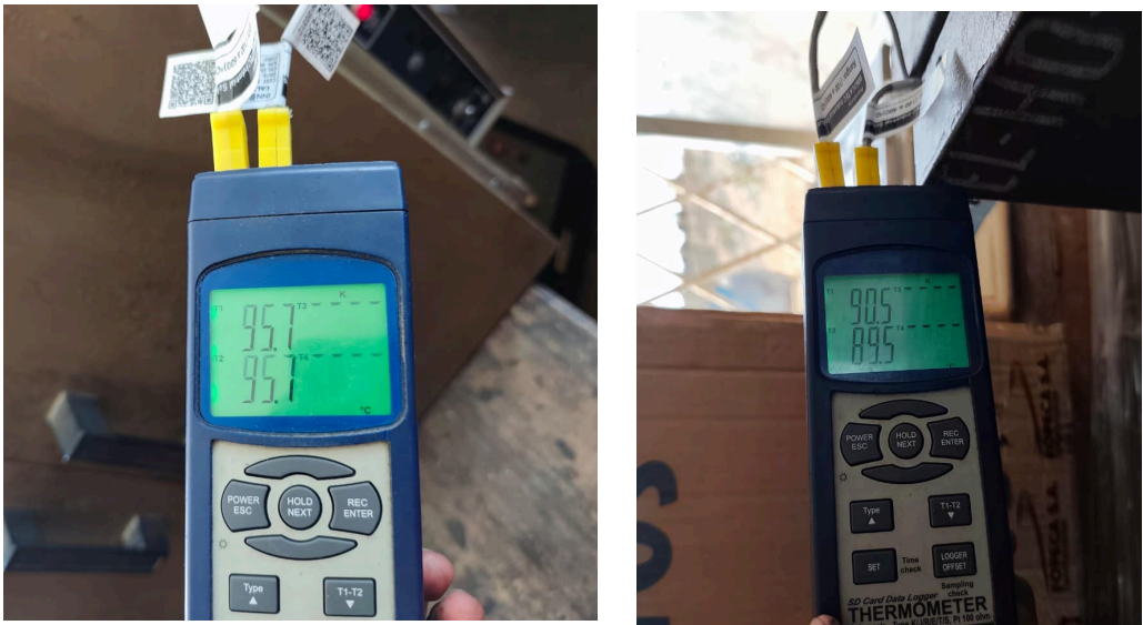
Figura 3. Lectura de Termocuplas