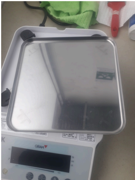
Presencia de polvo en el plato de pesaje