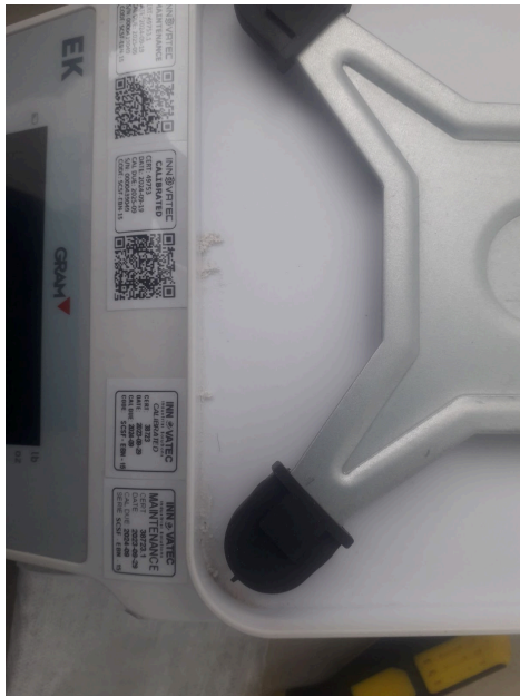
Presencia de residuos químicos