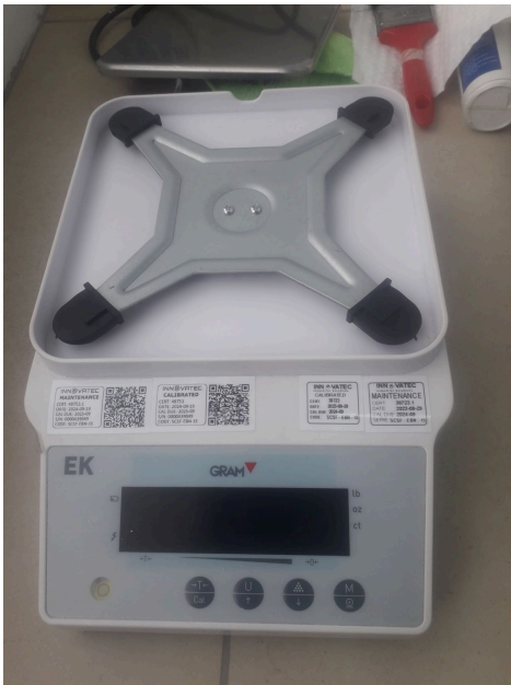
Vista general del equipo