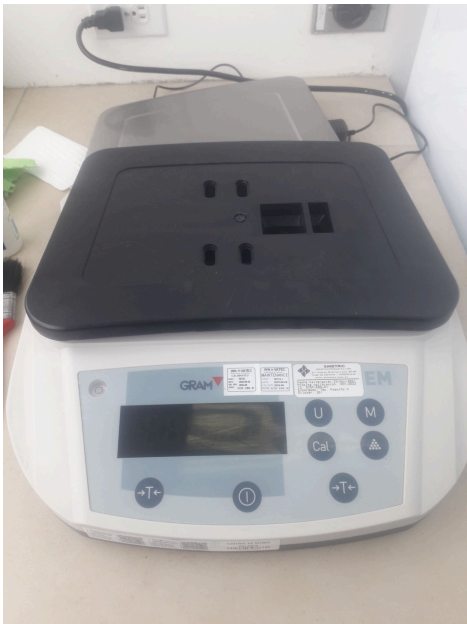
Vista general del equipo