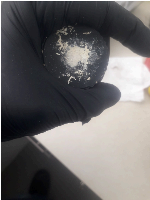
Presencia de residuos químicos