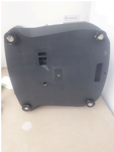
Presencia de residuos químicos en las patas de la balanza