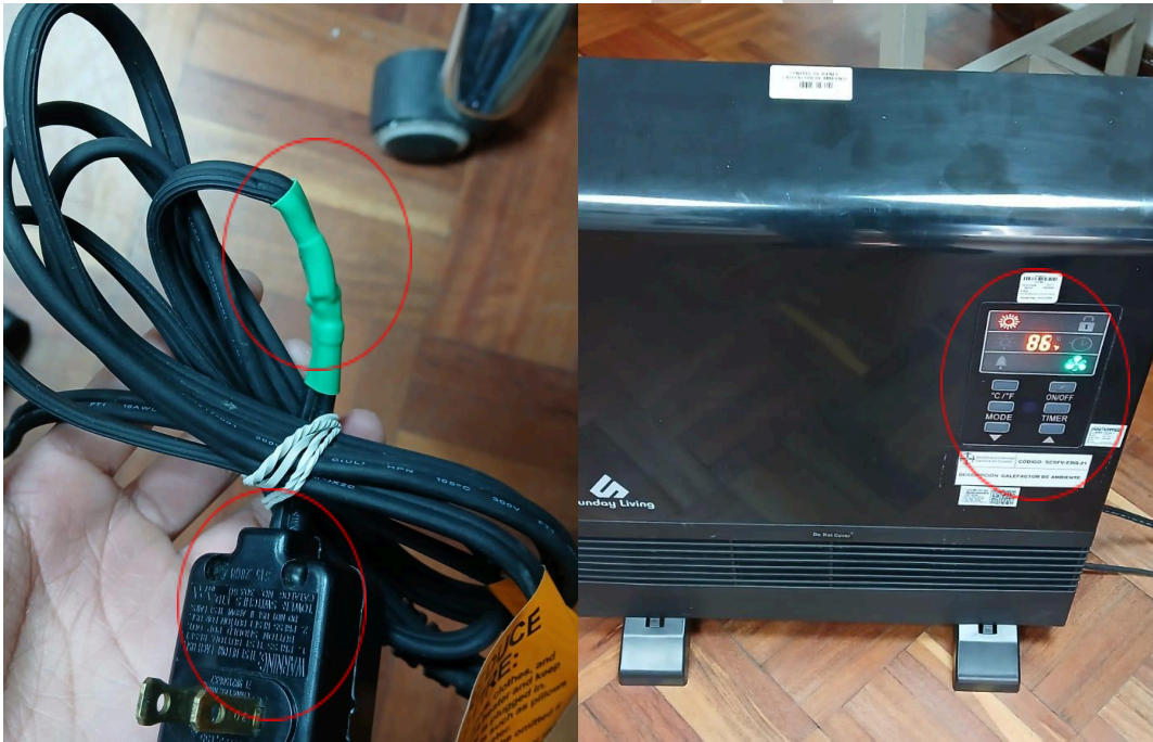
Figura 2. Nuevo conector arreglado y encendido del equipo.