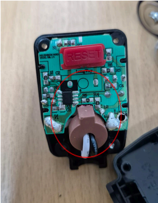
Figura 1. Conector dañado.