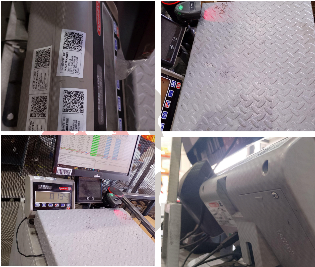
Figura 1. Mantenimiento preventivo básico