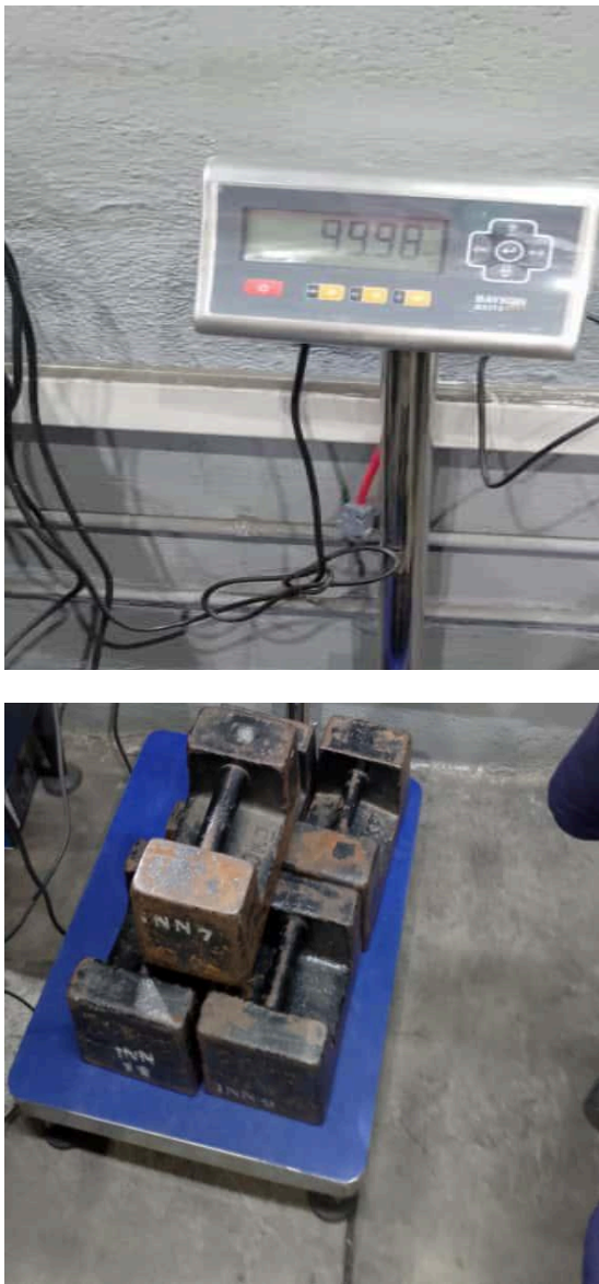
Fig.1 Mantenimiento del Equipo.