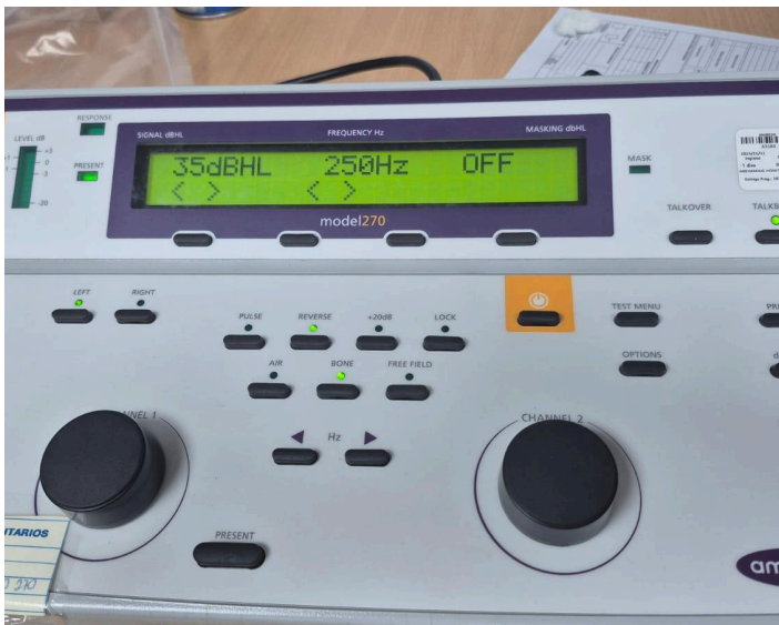
Figura 3: Encendido del equipo.