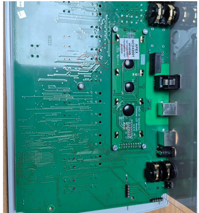
Figura 2: Vista posterior de la placa electrónica.