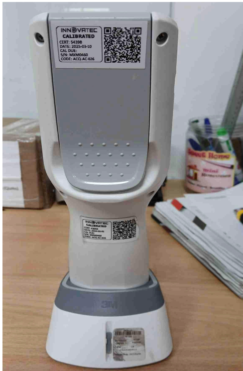
Figura 2. Parte trasera del equipo.