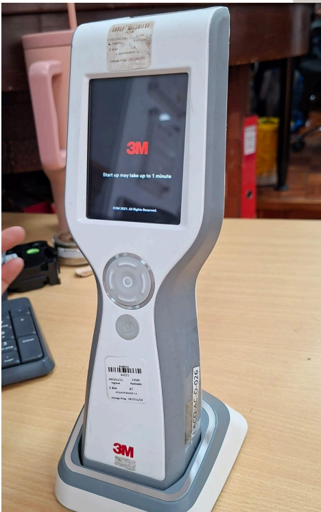
Figura 3. Reinicio de equipo sin éxito