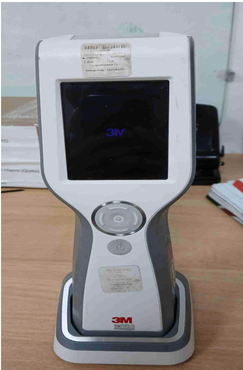
Figura 1. Vista frontal del equipo.