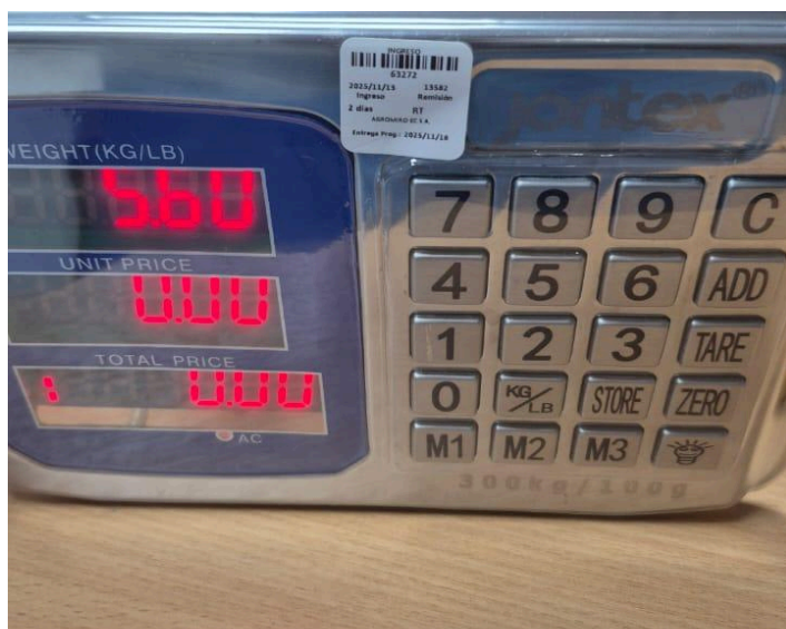
Figura 3: Funcionamiento del equipo.