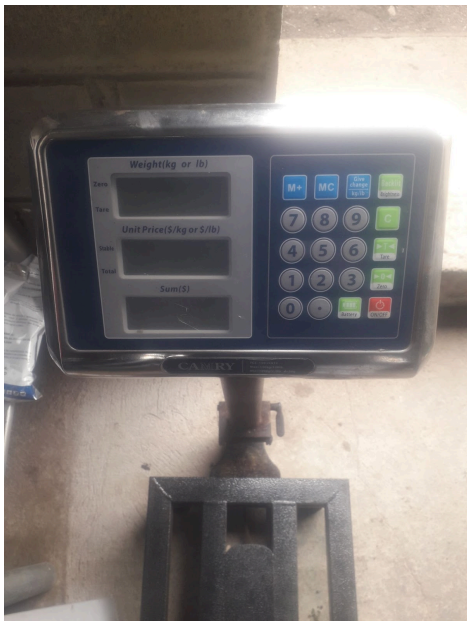
Vista general del equipo