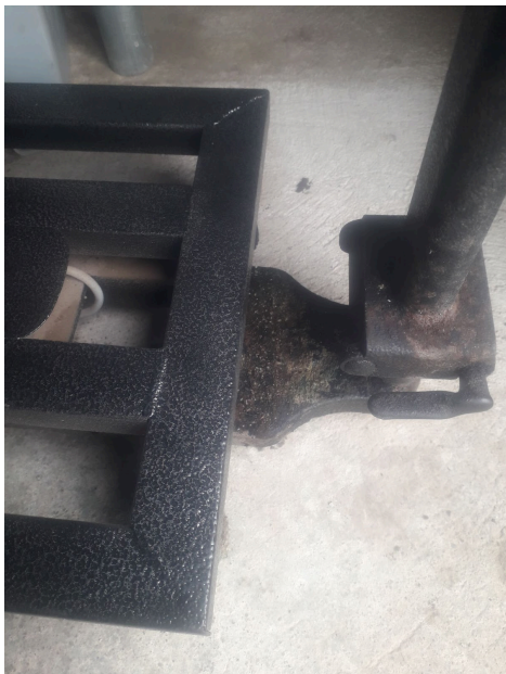
Presencia de Óxido