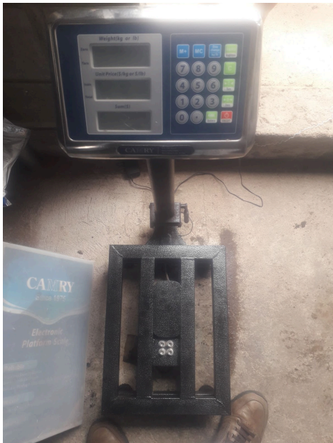
Vista externa de la Balanza luego del mantenimiento