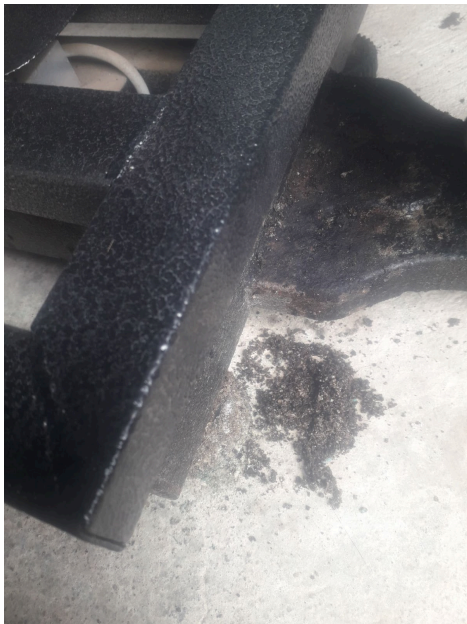
Presencia de bastante suciedad y polvo bajo el plato de la Balanza