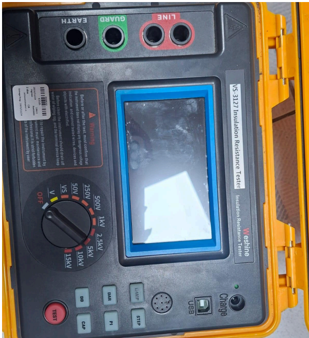
Figura 1: Equipo.