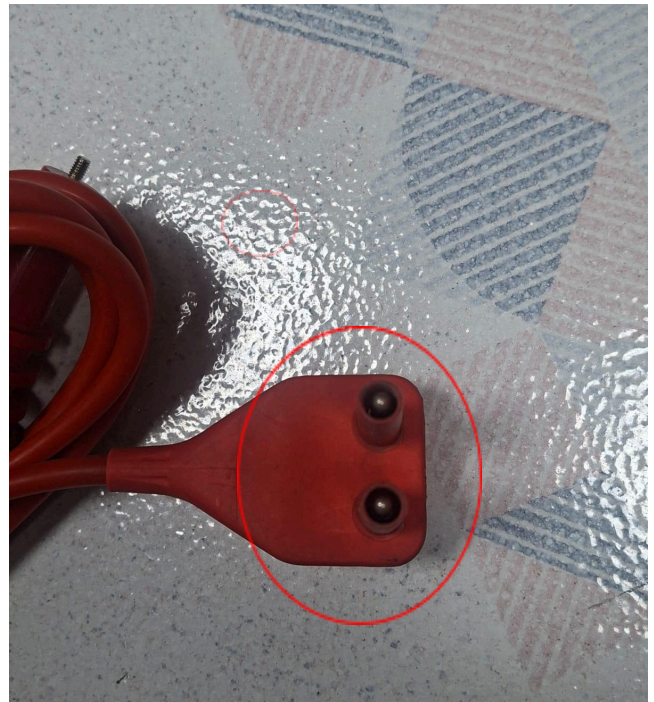
Figura 2: Cable con falla.