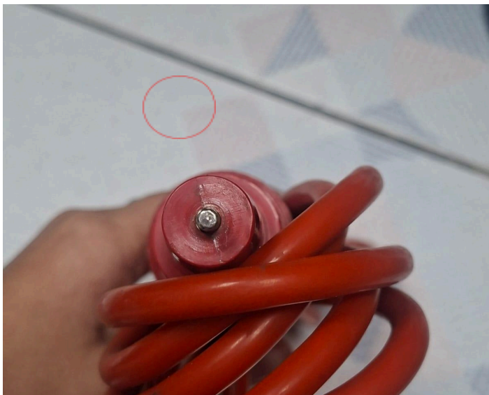
Figura 3: Vista de la punta del cable con falla.