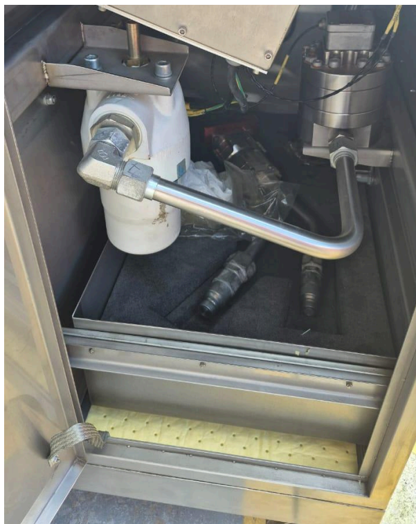
Fotografía 4. Inspección de fugas en el interior del equipo, limpieza de residuos de aceite.