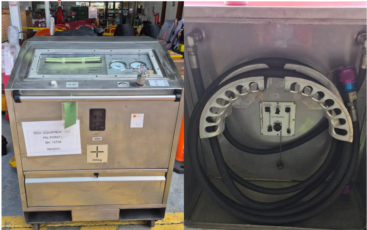
Fotografía 1. Estado superficial del equipo.