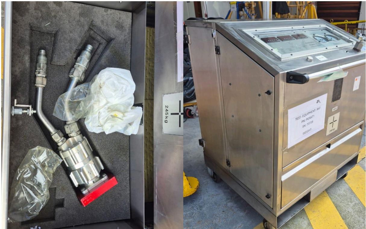
Fotografía 3. Cajón sin presencia de fugas.