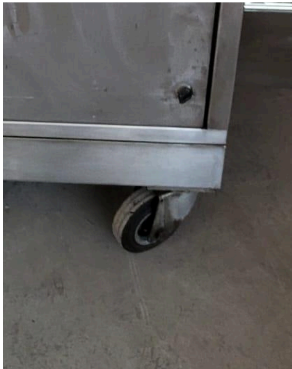
Fotografía 6. Revisión de daño en frenos del equipo.