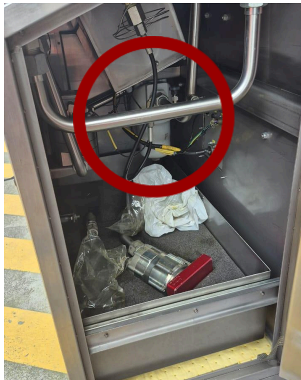
Fotografía 2. Goteo en unión de tuberías.