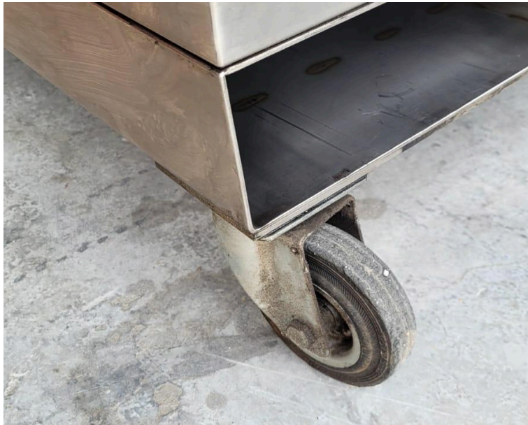
Fotografía 5. Estado superficial de las llantas del equipo.