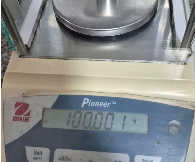
Figura 1. Funcionamiento del equipo.