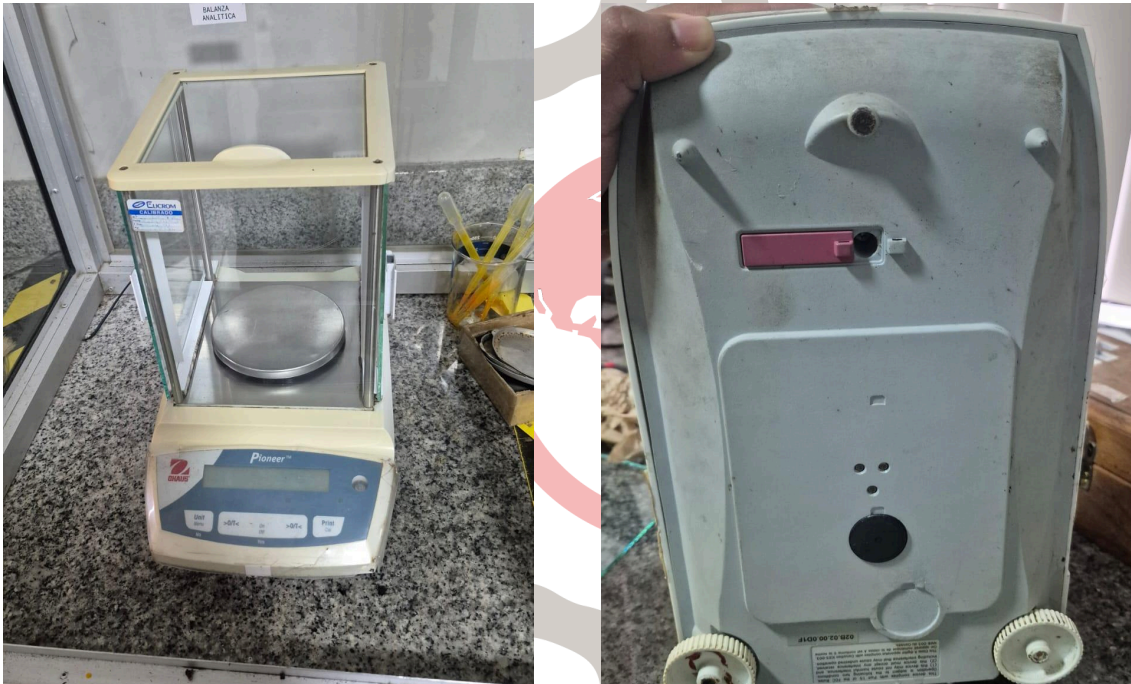
Figura 2. Componentes mecánicos del equipo.