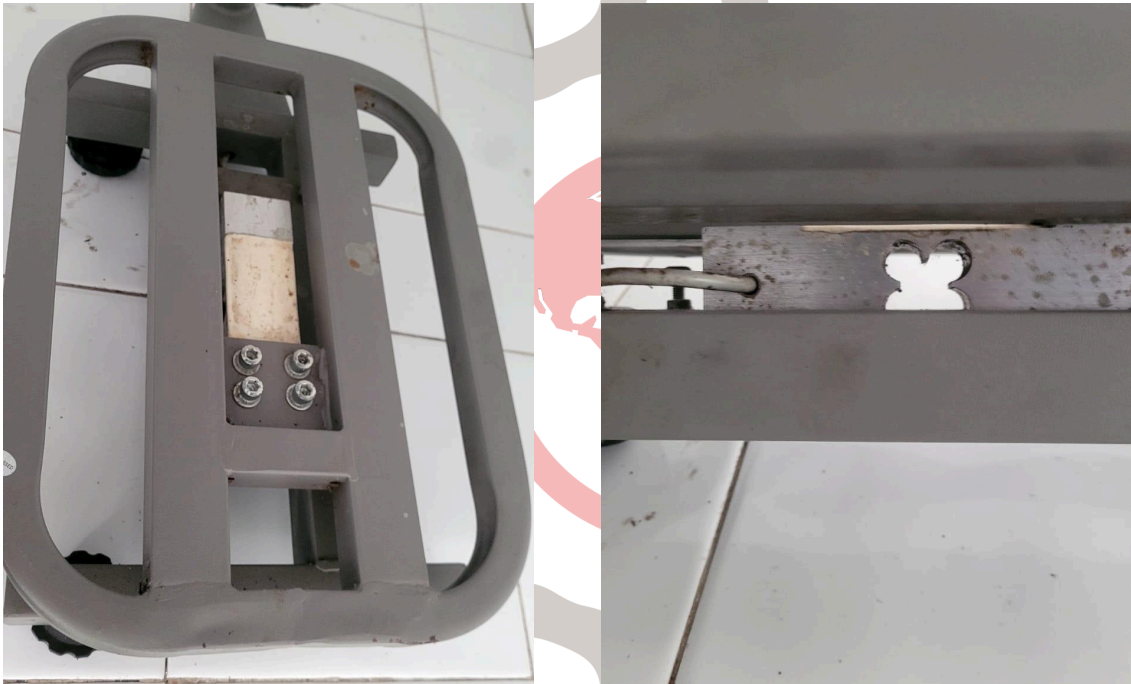
Figura 2. Componentes mecánicos y electrónicos del equipo.