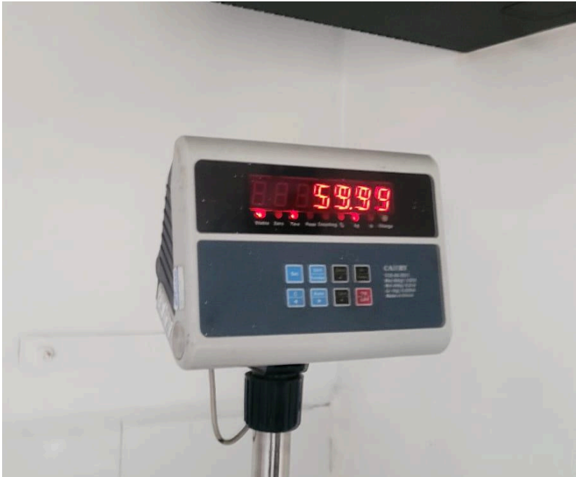
Figura 1. Funcionamiento y ajuste del equipo.