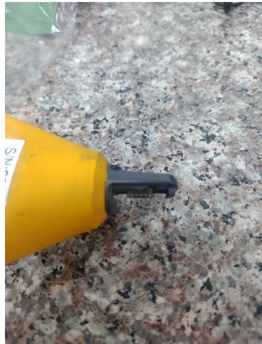
Plástico que recubre los sensores se encuentra roto