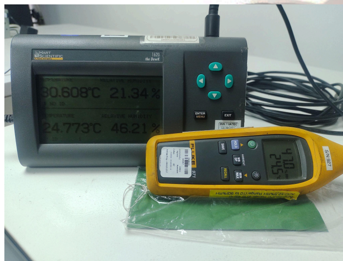
Verificación de lecturas respecto a un equipo Patrón