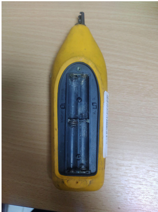
Presencia de óxido en el compartimento de Baterías