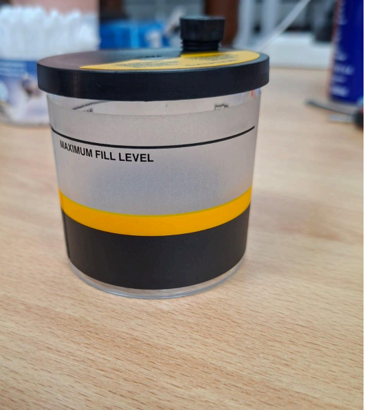
Fig. 3: Ausencia de fugas en contenedor