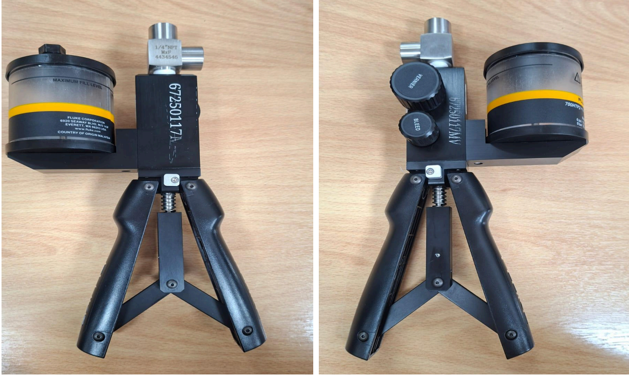
Fig. 1: Vista general del equipo