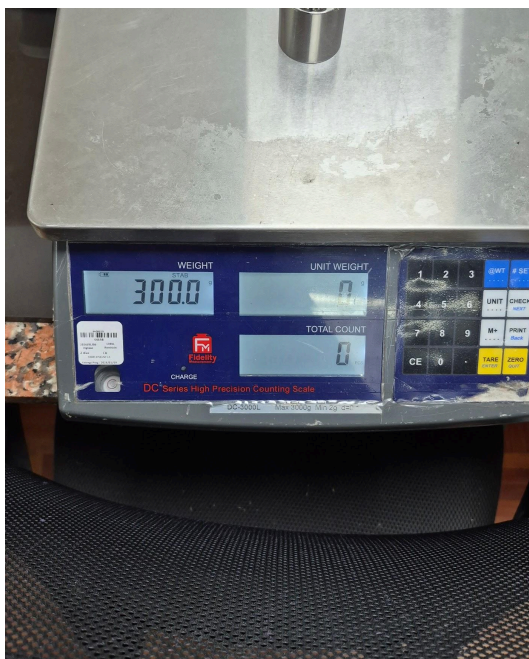
Figura 1. Vista frontal del equipo.