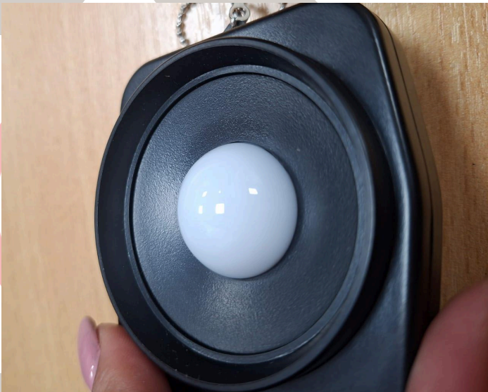
Fig. 3: Fotosensor