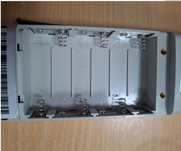
Fig. 2: Componente eléctrico, sin sulfatación