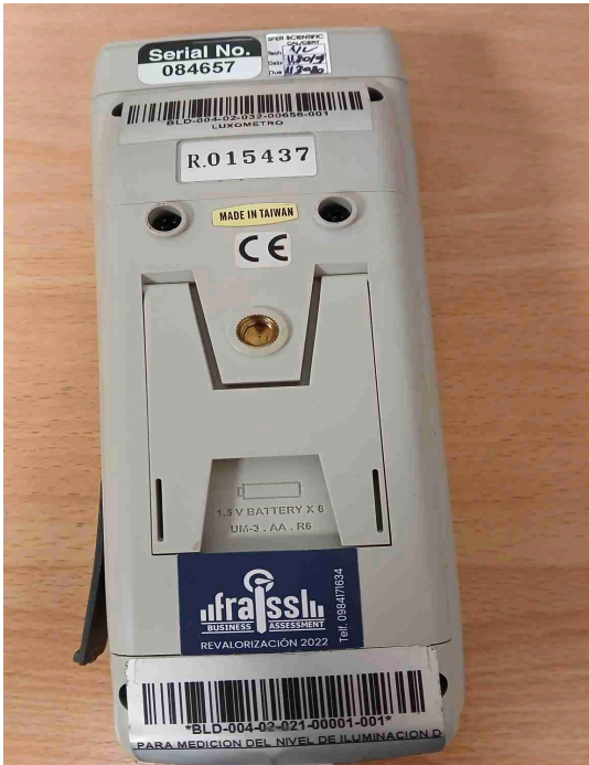
Fig. 1: Vista completa del equipo