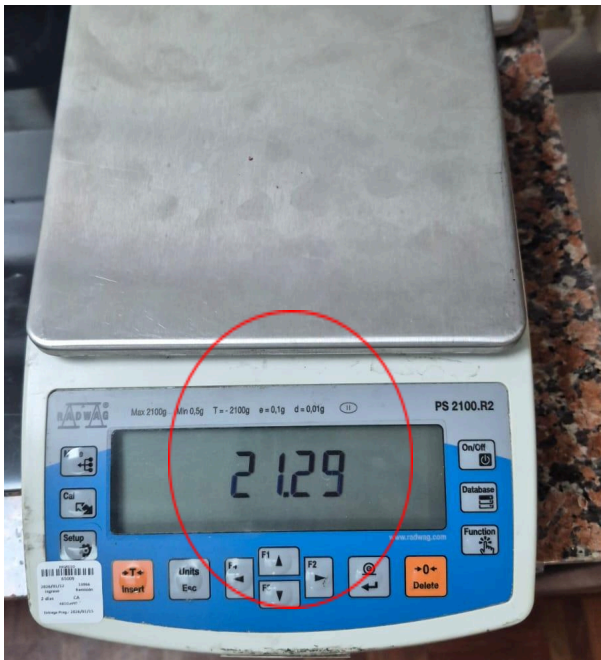
Figura 1: Valor en pantalla si nada de peso.