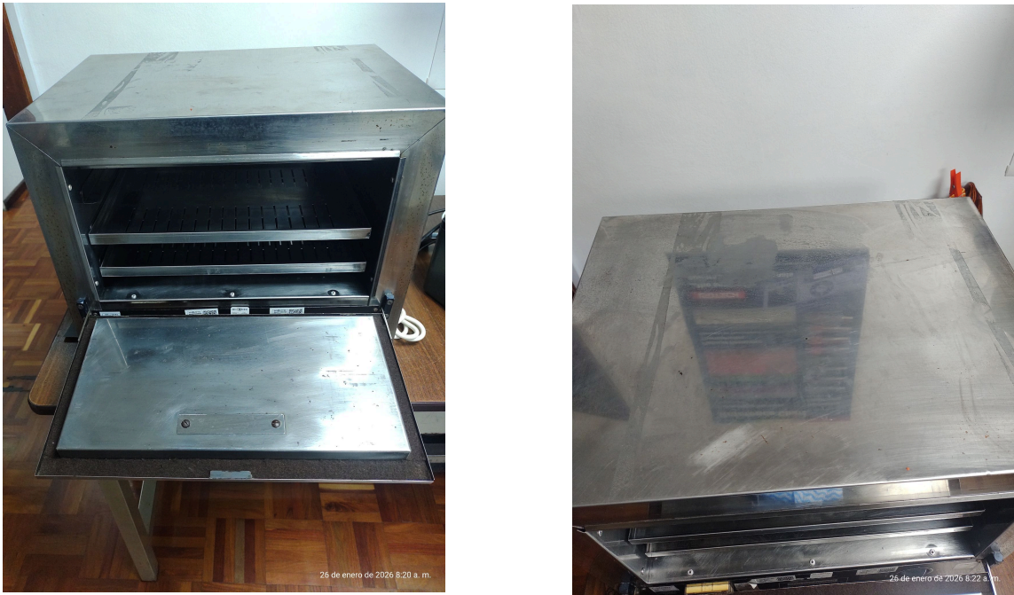
Figura 2. Presencia de suciedad el la carcasa y buen estado del interior del equipo