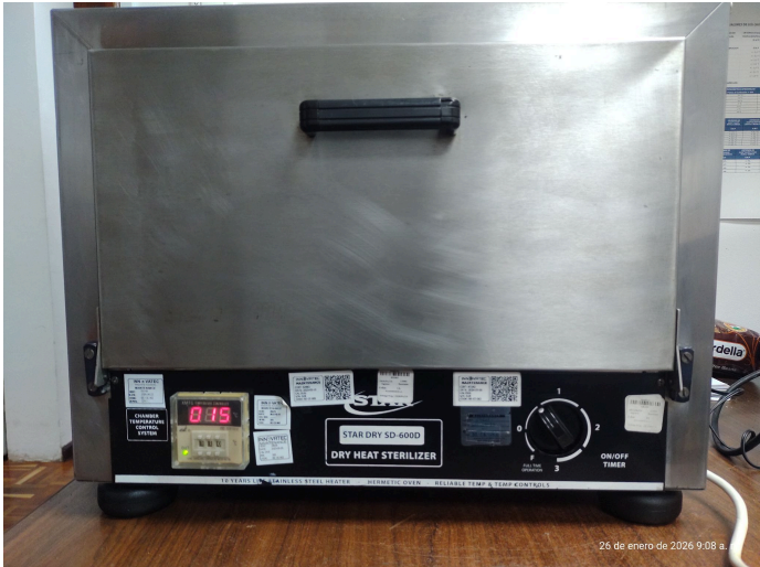
Figura 1. Estado dinal del equipo