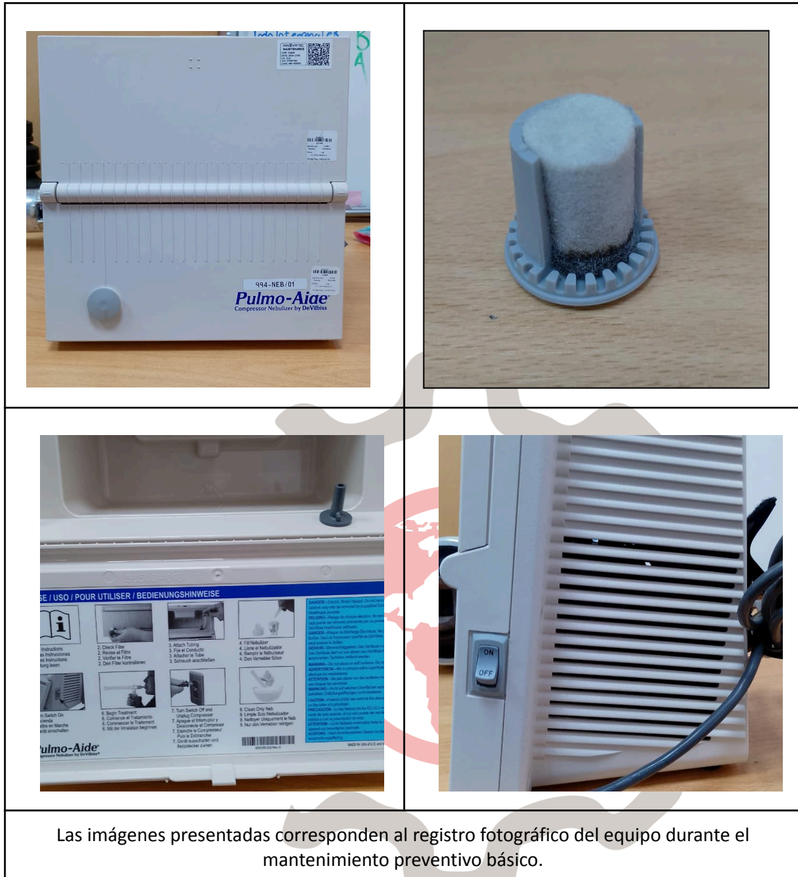
Las imágenes presentadas corresponden al registro fotográfico del equipo durante el mantenimiento preventivo básico.