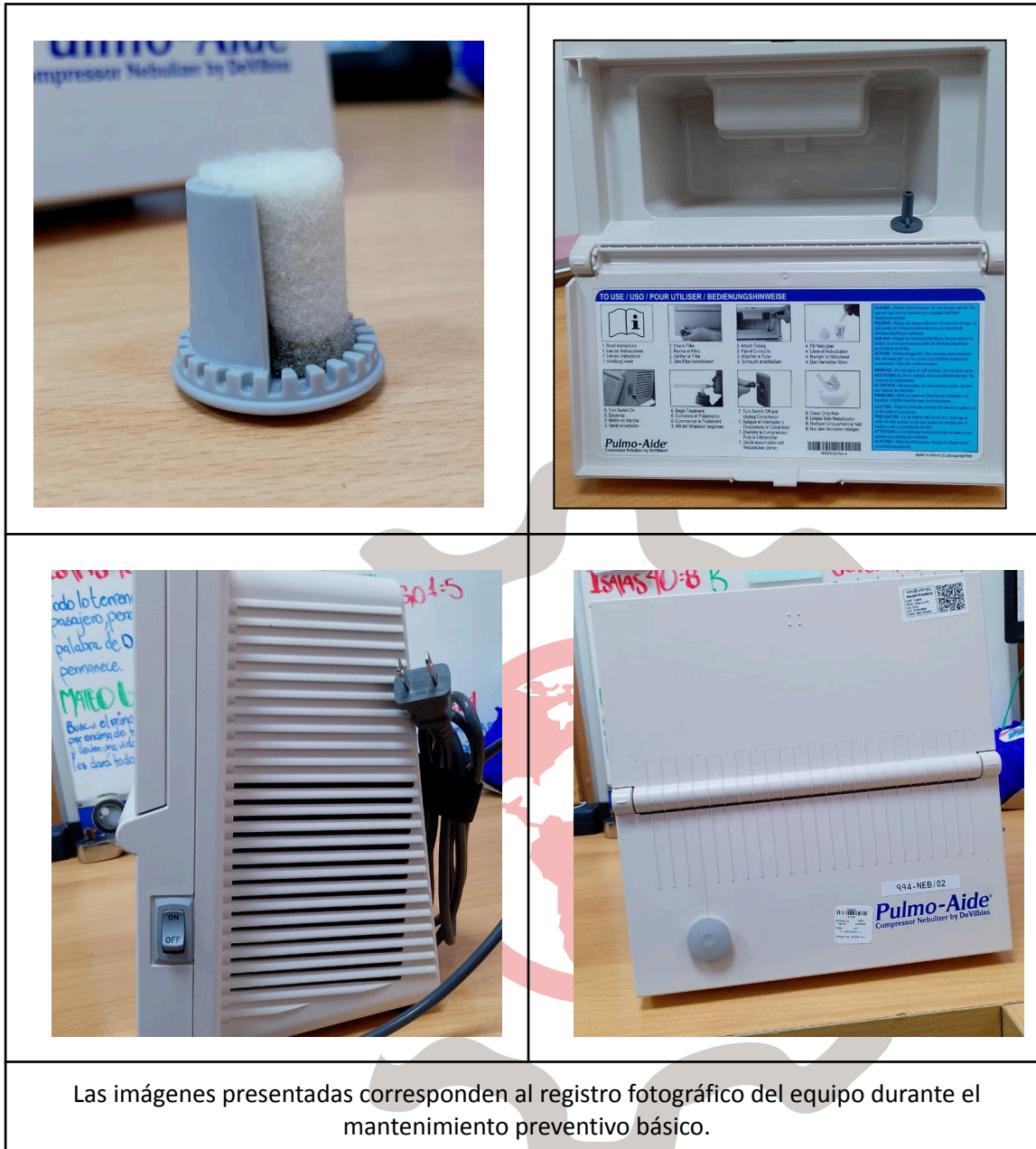
Las imágenes presentadas corresponden al registro fotográfico del equipo durante el mantenimiento preventivo básico.