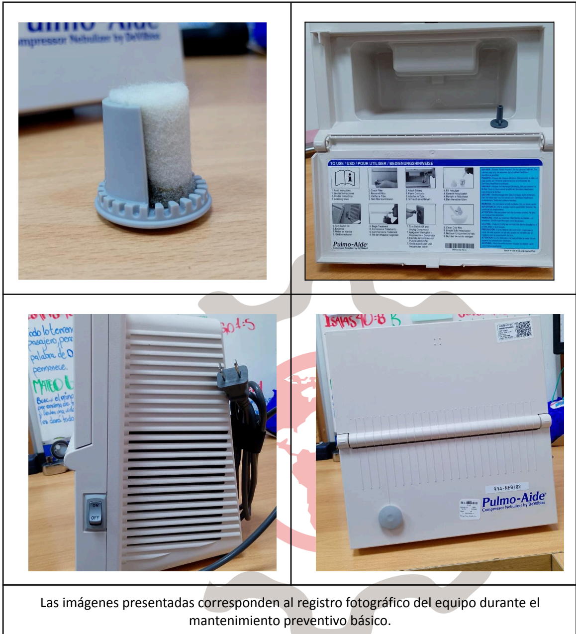
Las imágenes presentadas corresponden al registro fotográfico del equipo durante el mantenimiento preventivo básico.