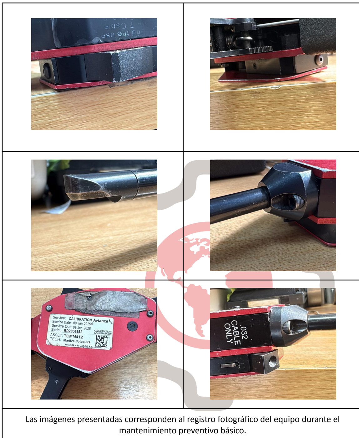
Las imágenes presentadas corresponden al registro fotográfico del equipo durante el mantenimiento preventivo básico.