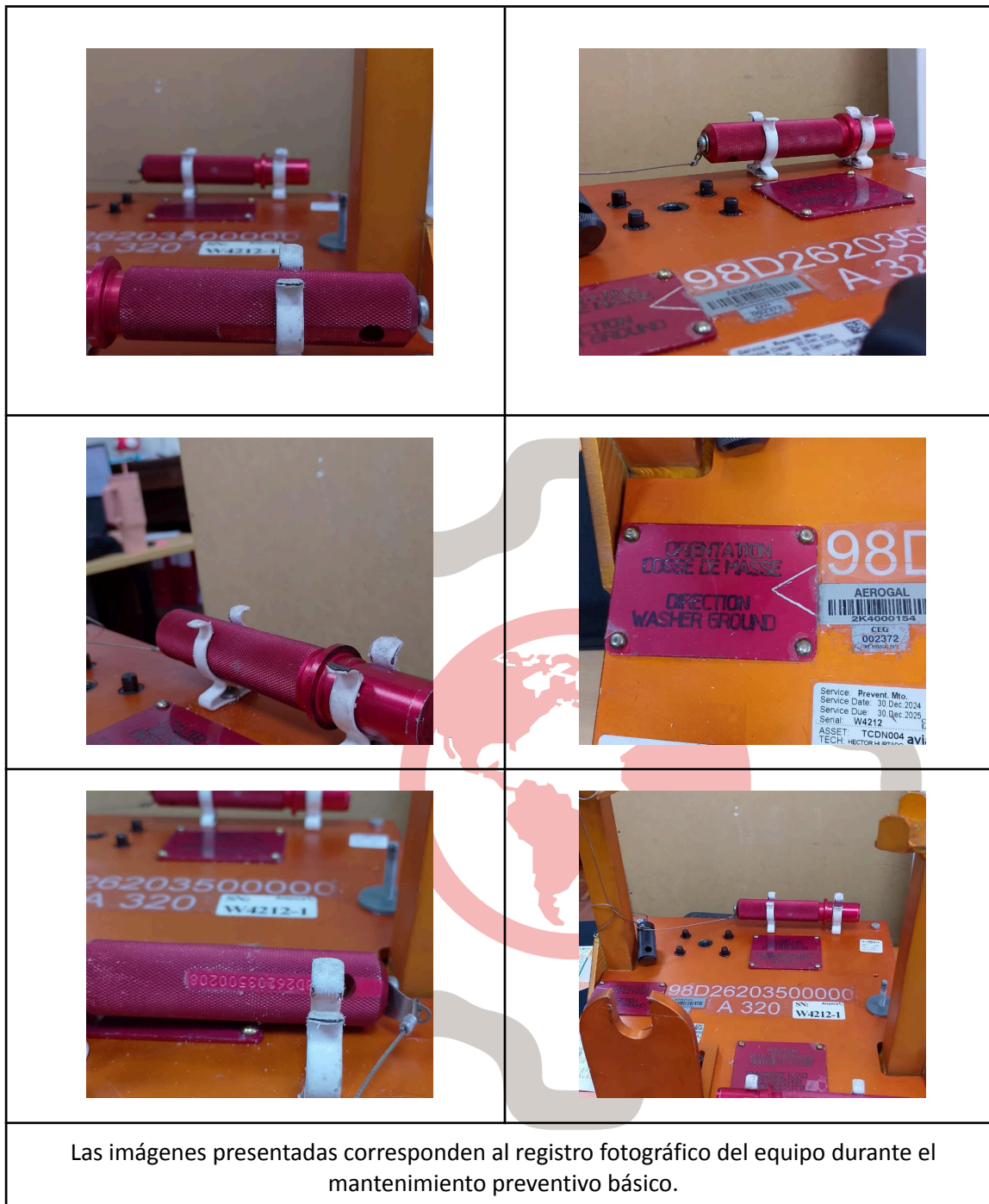
Las imágenes presentadas corresponden al registro fotográfico del equipo durante el mantenimiento preventivo básico.