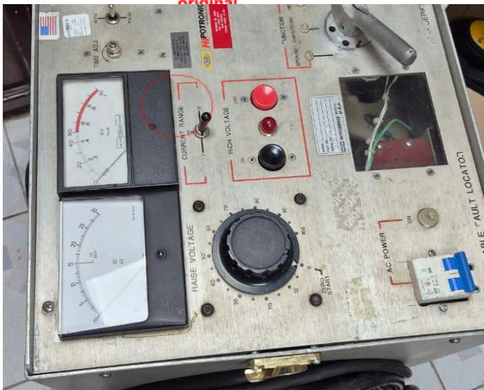
Figura 3: El equipo permanecerá apagado.