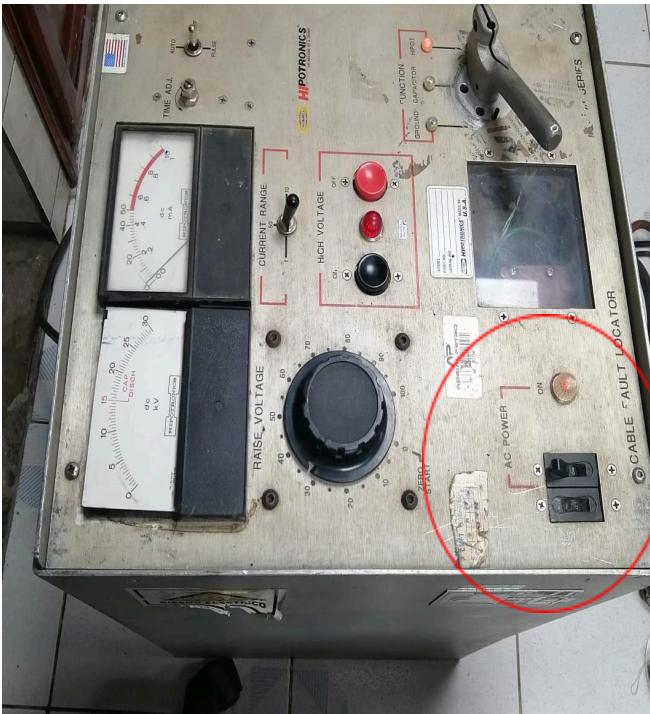
Figura 1: Equipo con el interruptor original