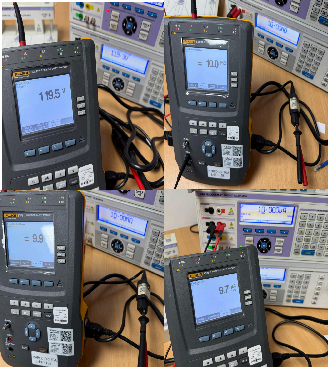
Figura 1: Prueba de funcionalidad.