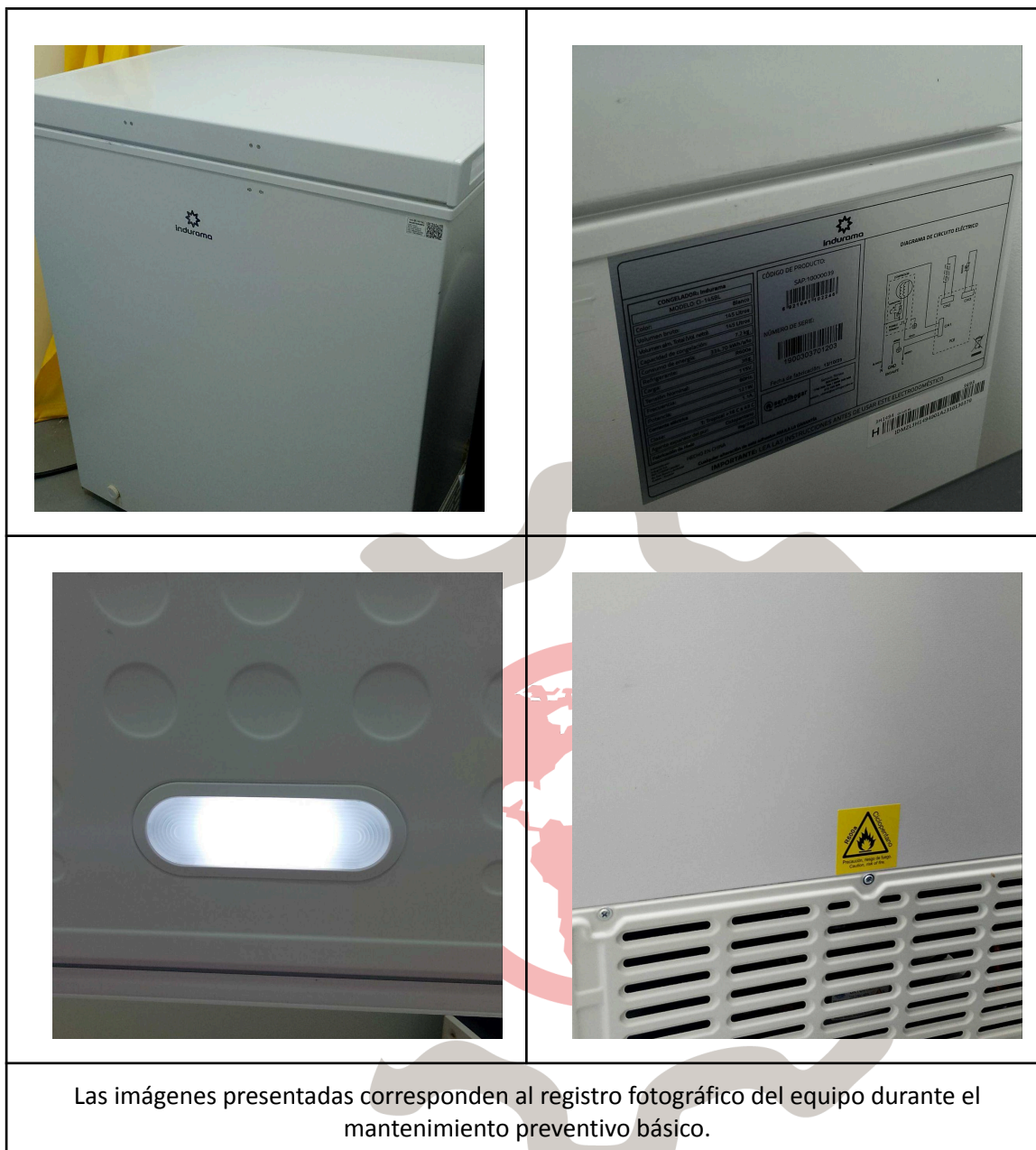
Las imágenes presentadas corresponden al registro fotográfico del equipo durante el mantenimiento preventivo básico.