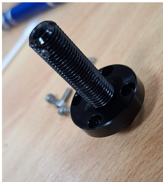
Fig. 4: Partes post-mantenimiento