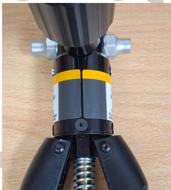
Fig. 2: Vista general del equipo después de mantenimiento