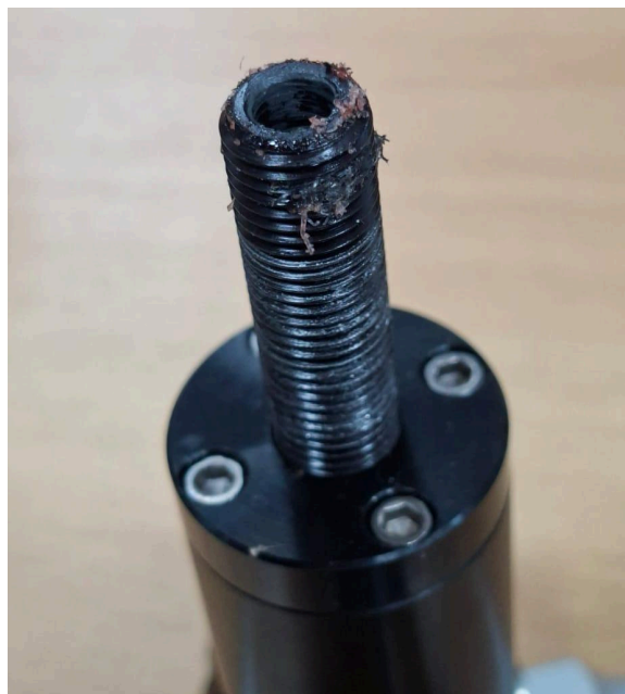
Fig. 3: Presencia de óxido y grasa acumulada antes de mantenimiento