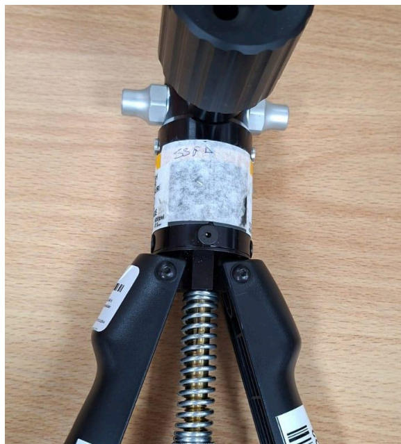
Fig. 1: Vista general del equipo antes de mantenimiento