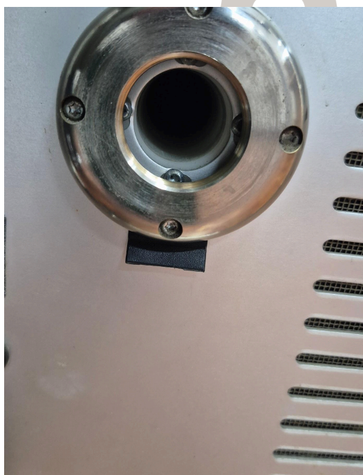
Figura 2. Funcionamiento del equipo.