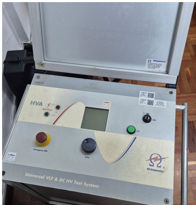
Figura 1. Vista frontal del equipo.