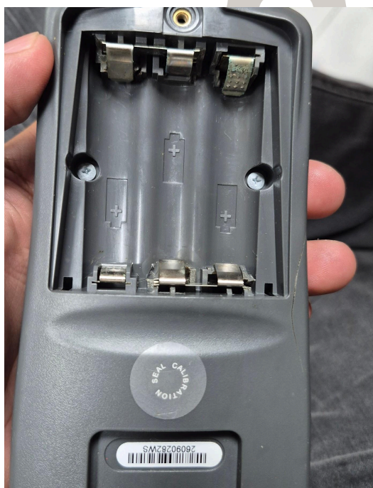
Figura 2. Vista posterior del equipo.