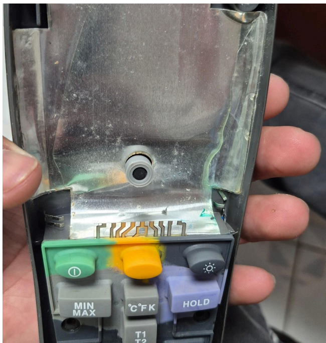
Figura 1. Vista frontal del equipo.