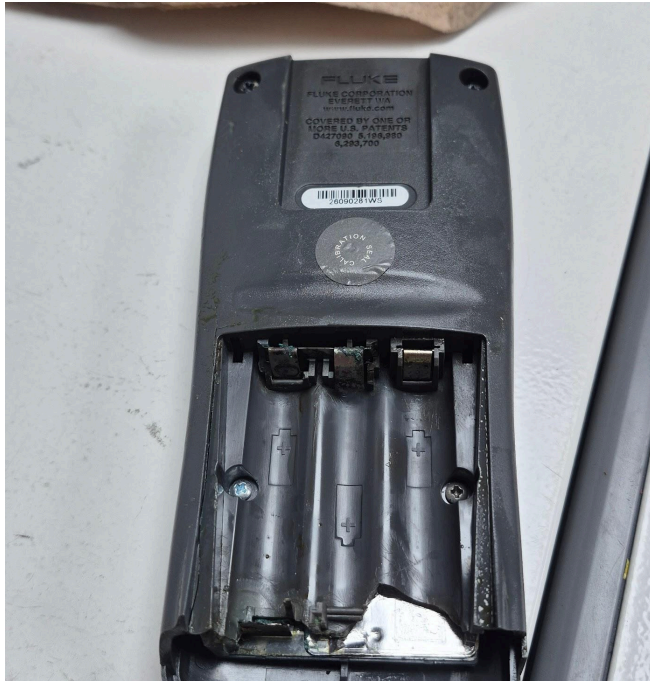
Figura 1. Vista posterior del equipo.