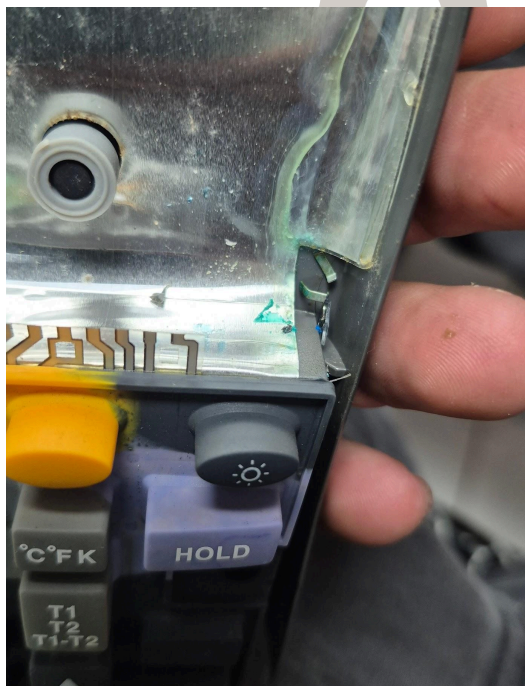
Figura 2. Sección sulfatada .