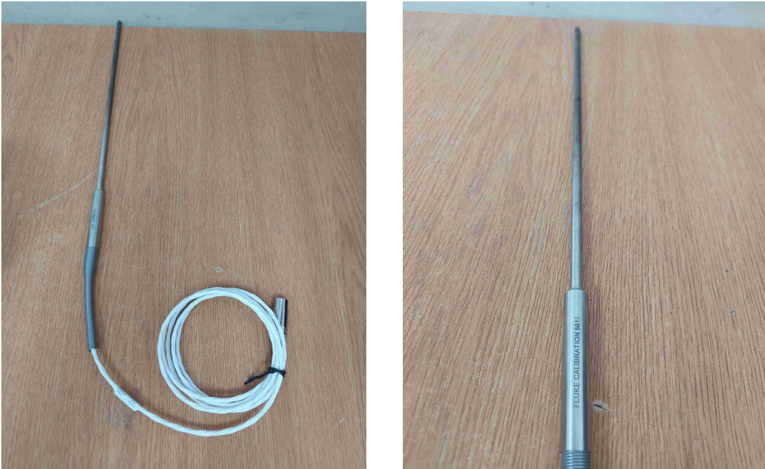
Figura 1. Vista general del equipo.